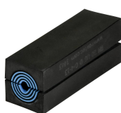
Module RM UG™ avec Multidiameter™