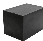
Modules pleins/diamètre unique RM UG

Pour plus d'informations, veuillez consulter roxtec.com .